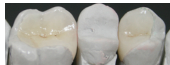
Inlay przygotowany przez technika stomatologicznego – pierwszy i trzeci od prawej