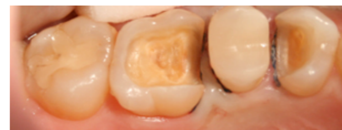
zęby opracowane po inlay – pierwszy i trzeci od prawej

pełnień w zębach metodą tradycyjną – np. kompozytową. Często w przydatku zniszczenia dużych fragmentów zęba założenie zwykłego wypełnienia może okazać się nieskuteczne i mija się z celem. Przeciążenia spowodowane siłami żucia zniszczyłyby rozległe wypełnienia tuż po jego wykonaniu, powodując odpryski materiału kompozytowego. W takich sytuacjach proponuje się pacjentowi onlay i inlay, ponieważ umożliwiają dokładną