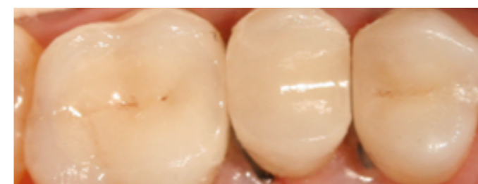
Inlay zacementowany na zębach (czarne punkty widoczne wokół zęba to nici retrakcyjne, które się usuwa) – pierwszy i trzeci od prawej